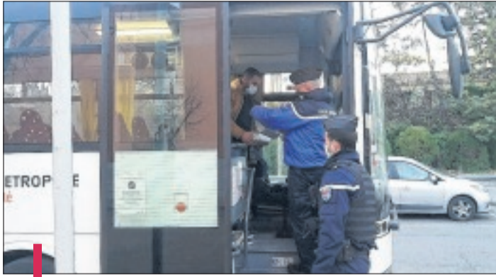
Aucune anomalie n'a été constatée.