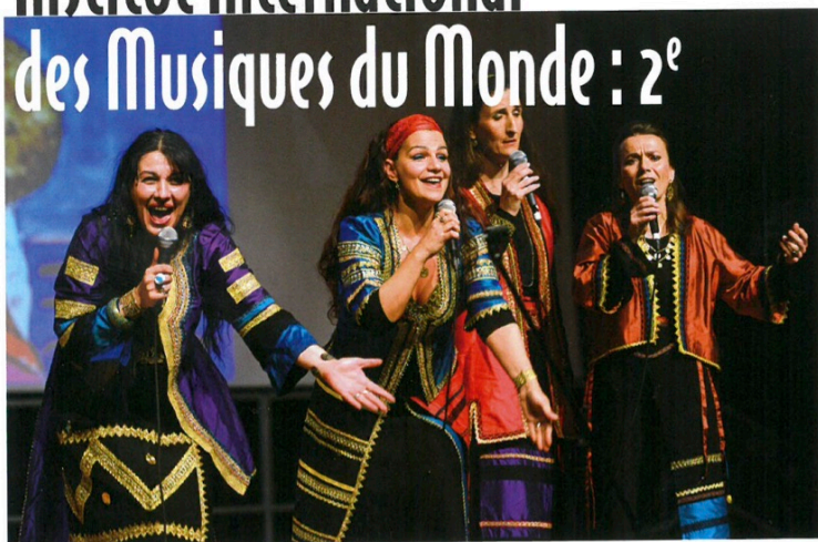
Concert de l'IIMM en octobre 2015 à l'Espace des Libertés avec le quatuor Balkanes.

Après un lancement plus que réussi, l'Institut International des Musiques du Monde présente du 15 au 19 février au Conservatoire de musique d'Aubagne sa seconde série de master-classes.