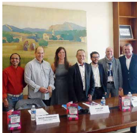
L'IIMM bénéficie du soutien de l'institut de l'intelligence sociale -dont les deux représentants sont à droite sur la photo-, un organisme privé spécialisé dans la connaissance du lien social.

* http://iimm.fr - Tél : 04.42.12.30.49.