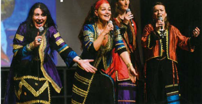
Concert de l'IIMM en octobre 2015 à l'Espace des Libertés avec le quatuor Bulkanes.

Après un lancement plus que réussi, l'Institut International des Musiques du Monde présente du 15 au 19 février au Conservatoire de musique d'Aubagne sa seconde série de master-classes.