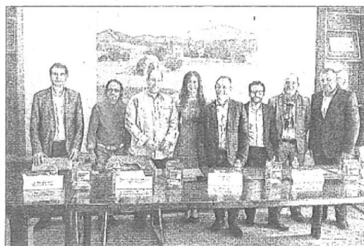
Les élus, les responsables et les artistes lors du lancement de l'Institut international des musiques du monde.

Concert de l'Institut International des Musiques du Monde, mercredi, à 20 h 30, à l'espace des Libertés, à la salle Stéphane-Hessel.